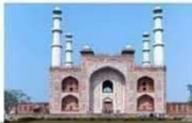
अकबर का मकबरा