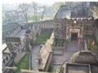
झाँसी का किला